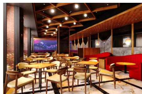
104席を設ける店内（イメージ）

名称：PUB&GRILL 7TAPS TAVERN（7タップス タバン） 住所：京都市下京区烏丸通り塩小路下る東塩小路町901番 京都駅ビル 東ゾーン1階 電話番号：075-744-0267 営業時間：11時～24時（L.O. フード23時、ドリンク23時30分） 定休日：無し 客単価：ランチ＝1,500円～2,000円、ディナー＝3,500円～5,000円 店舗面積：77.38坪 席数：104席 公式Instagram： https://www.instagram.com/7taps_tavern/