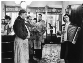
ローベル・ドアノー 《音楽好きの内屋》パリ 1953年2月 ゼラチンシルバープリント

フランスの国民的写真家ローベル・ドアノーはパリを舞台に多くの傑作を生み出しています。パリの街角にあふれるシャンソンやジャズなど様々な音楽シーンを題材に1930年から90年代にかけて撮影された、音楽的感覚に富んだ作品と資料、約200点を展示しております。