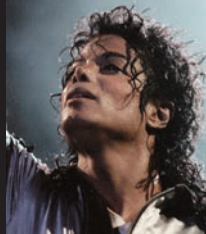
パノドワールドツアー 1988

「史上最も成功したエンターテイナー」として語り継がれるマイケル・ジャクソン(1958-2009)。本展では、世界中のファンを熱狂の渦へと巻きこんだ3つのワールドツアーでの圧巻のライブ・パフォーマンスを中心に、100点を超える写真を展覧します。亡くなった今もお多くのファンを魅了し続けているマイケル・ジャクソン。彼の音楽と共に、展覧会をお楽しみください。