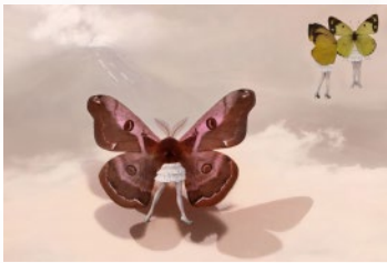
「蝶獣戯画」(部分) ©安珠

京都の源である平安京に焦点をあてた「Invisible Kyoto-目に見えぬ平安京-」。伝承されている物語から平安京を写真で紐解きます。京都の伝統工芸や貴重な和紙を駆使して、80点以上の作品を展示。日本人の想像力と美意識、平和への願いが集結した平安京「安珠の写真世界」でご堪能ください。